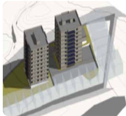
Sándalo 90 apartamentos