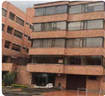
Edificio Torremolinos 18 apartamentos